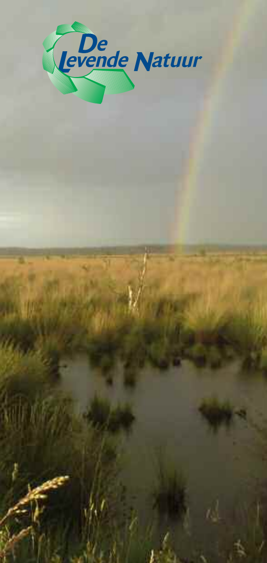
Foto 1. Het muggenparadijs Fochtelooërveen met regenboog.